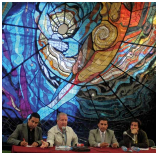
Rempa organizó una conferencia informativa sobre la conservación de los bosques comunitarios el 5 de noviembre de 2007, en Toluca, Estado de México.

Otra aportación a la profesionalización y enlace de los integrantes de la red en Perú es Comunicaciones Aliadas, misma que hace talleres, conferencias y guías de periodismo ambiental.