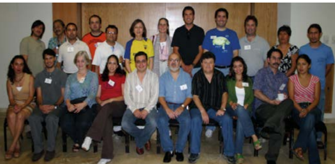
La primera Reunión Nacional de la Red Mexicana de Periodistas Ambientales, se desarrolló como Conferencia Regional de SEJ los días 26 y 27 de mayo de 2007, en Boca del Río, Veracruz, México.