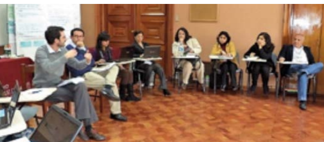
El Ministerio del Ambiente en Perú, la Fundación Friedrich Ebert, y la Escuela de Periodismo de la Universidad Jesuita Antonio Ruiz de Montoya apoyaron a la realización de este encuentro.