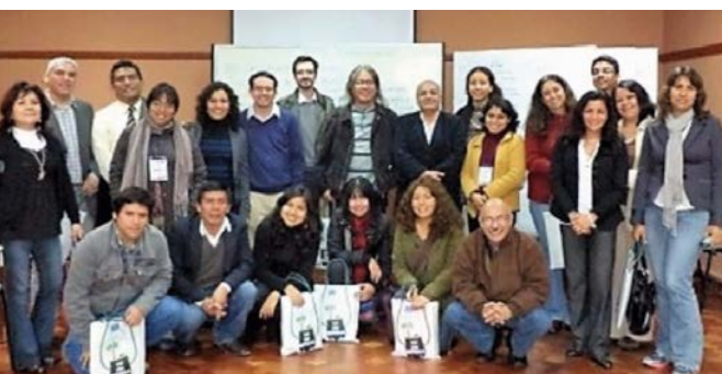
La Red de Comunicación Ambiental Latinoamericana y del Caribe (Red-CALC) se reunió por primera vez en 2012 en Lima.