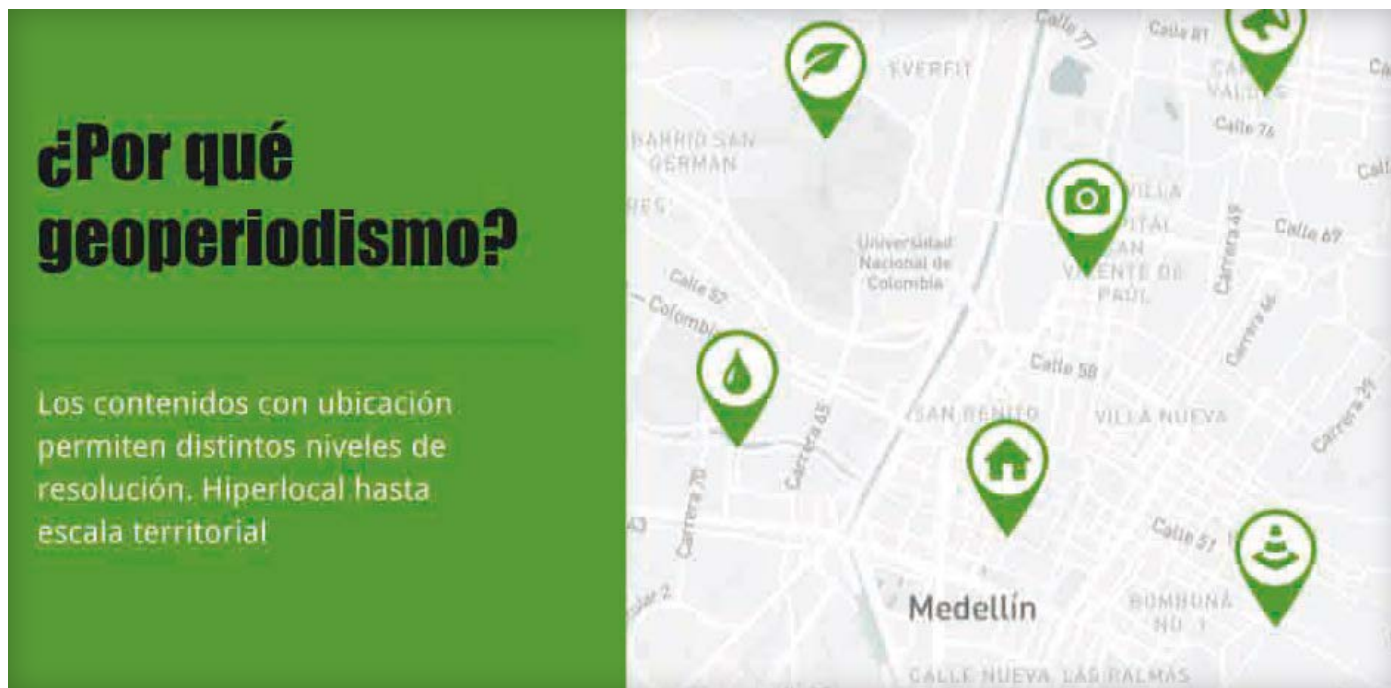
Diseño por Luiza Peixe/Cardume

Si estás dispuesta/o a experimentar con la creación de nuevas narrativas ambientales o deseas encontrar primicias mediante el uso de datos, un buen comienzo es hurgar en los repositorios de información pública. Y algunos de los más ricos para nosotros, los periodistas ambientales, son las imágenes satelitales.