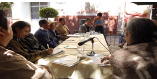
Rempa organizó una conferencia informativa sobre la conservación de los bosques comunitarios en Aguascalientes, Ags., México el 7 de marzo de 2008.